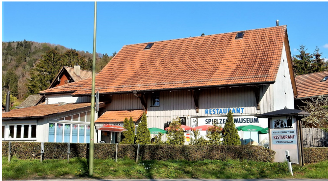
Spielzeugmuseum PEGASUS SMALL WORLD

wollen. Der Vorstand freut sich da auf Ideen aus dem Verein.