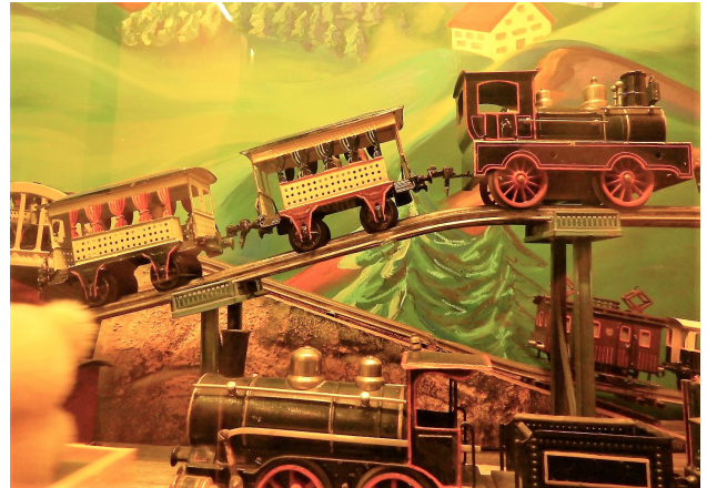
Uralte Berg- und Talbahn

Hobby-Sammler-Club (HSC) verschickt worden. Gegen 13Uhr30 tröpfelten die 17 angemeldeten von allen Seiten im Spielzeugmuseum PEGASUS im Habersaat, unweit vom schönen Türlerseer See ein. Der Wintergarten des Museums war für die bei schönstem Wetter stattfindende Versammlung bereit, sodass diese pünktlich beginnen konnte. Jahresergebnis, Budget und Jahresbericht wurden ohne Gegen-